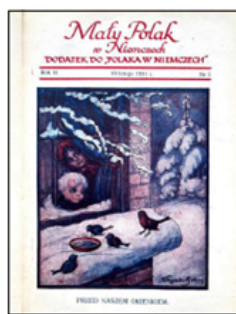
Okladka „Małego Polaka w Niemczech” 1931, nr 2

Przygotowała: Małgorzata Błach-Margot Projekt: Andrzej Samejwaś Zdjęcia: Jerzy Stępiński