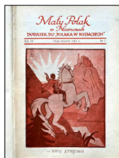
Okladka „Małego Polaka w Niemczech” 1931, nr 1