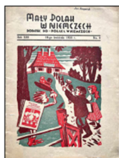
Okladka „Małego Polaka w Niemczech” 1936, nr 4