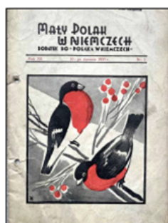
Okladka „Małego Polaka w Niemczech” 1932, nr 1