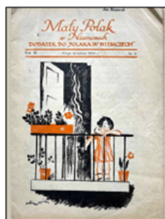
Okladka „Małego Polaka w Niemczech” 1934, nr 3